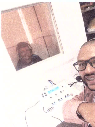
Foto dos atendimentos realizados na APAE DE SÃO PEDRO DO SUL

Associação de Pais e Amigos dos Excepcionais - APAE São Pedro do Sul – RS CNPJ: 89045.900/0001-69 / CEP: 97.400-000 Endereço: Rua 25 de Julho, n. 426, Bairro: Nova Alemanha Fone: (55) 3276 – 1856 / E-mail: saopedrodosul@apaers.org.br